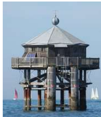
Phare du bout du monde

Nous voyons à tribord la Tour du Sergent et la Tour de la Lanterne et à babord, la tour de la chaîne et plus loin, le phare du bout du monde (celui-ci est la réplique à l'identique du phare du bout du monde de Patagonie érigé en 1884 sur l'île des États située à l'est de la péninsule Mitre en Terre de Feu.) et enfin nous sortons du chenal et prenons la haute mer.